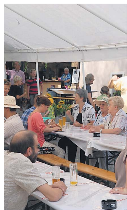
Gemütlichkeit: Geselliges Beisammensein am Himmelrieder Dorfplatzfest.

The Groovesection. Auch für das leibliche Wohl wurde in Himmelried gesorgt: Hungrige mussten sich zwischen Spaghetti, Grilladen, Fish & Chips, Burger und einem grosszügigen Kuchenbuffet entscheiden. Der Durst wurde vorzugsweise mit heimischem Chastelbach-Bier gelöscht. Einziger Wermutstropfen war das unstete Wetter, am Abend öffnete Petrus die Schleusen. Der guten Stimmung tat dies aber keinen Abbruch.