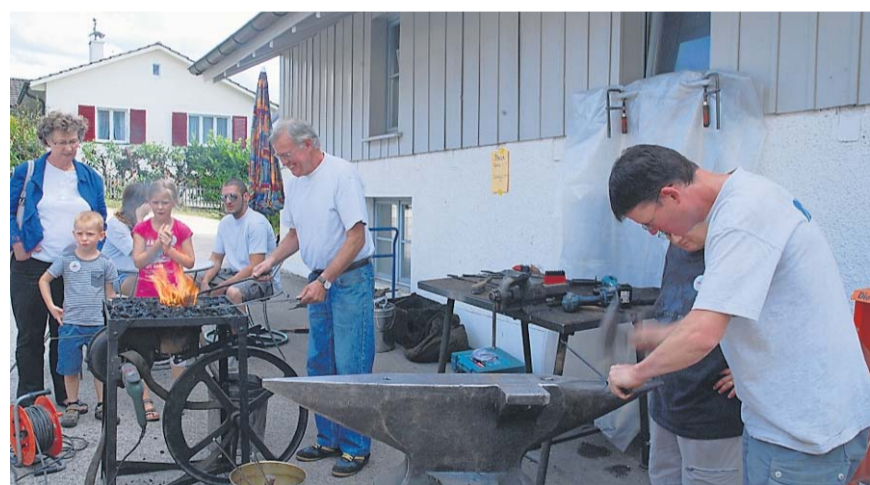
Selbstversuch: Die Besucher durften sich ihren eigenen Grillspieß schmieden.

Himmelried lud mit einem kleinen aber feinen Angebot zum Dorfplatzfest ein. Der Anlass lockte bereits am Nachmittag viele Besucher an und überzeugte mit einem vielfältigen Programm. Die Jüngsten durften in den Räumlichkeiten der ortsansässigen Spielgruppe span-