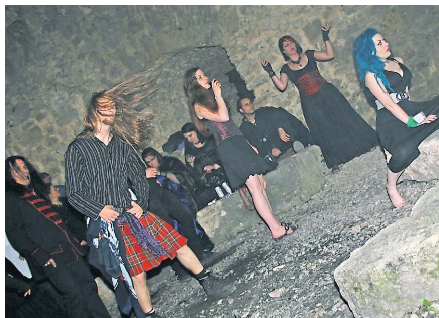
Mähne schütteln: Wilde Musik und wilde Horden.

Es lohnt sich, das CD-Booklet zur Hand zu nehmen und sich mit den Tex-