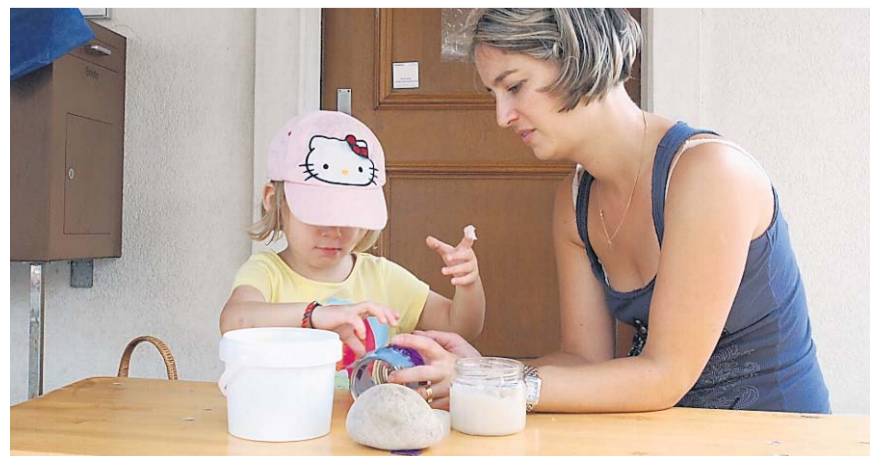
Miteinander gehts besser: Voller Einsatz beim Laternenbasteln.

nenden Geschichten lauschen. Zudem hatten die Kinder die Möglichkeit, ihr eigenes Latärnli zu basteln, mit welchem sie am Abend den Laternenumzug absolvieren konnten. Die älteren Kinder und Erwachsene durften sich